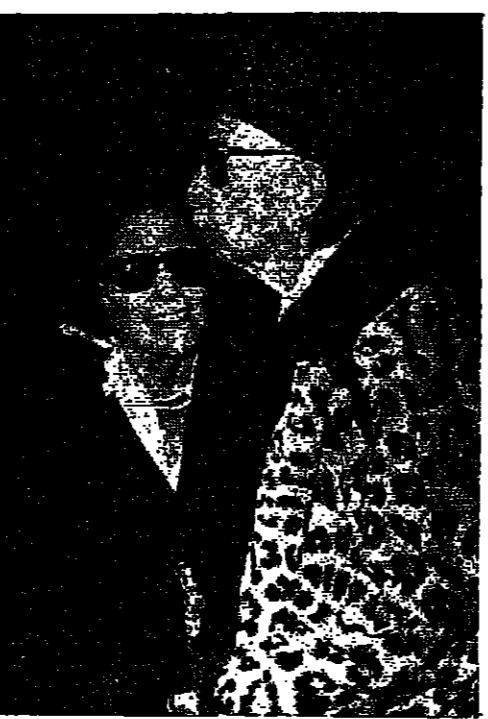
سلفادور دالي مع غالا: الغريب الثاني بعدها